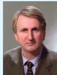
dr. Safet Halilović ministar za ljudska prava i izbjeglice BiH