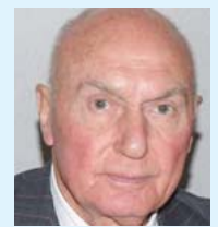
Kemal Baysak Ambasador SSDBiH Turska