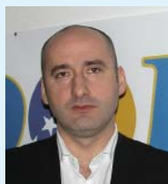
Belmin Zec Potpredsjednik Austrija