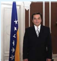
dr. Haris Silajdžić, predsjedavajući Predsjedništva BiH