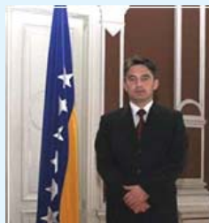
Željko Komšić član Predsjedništva BiH